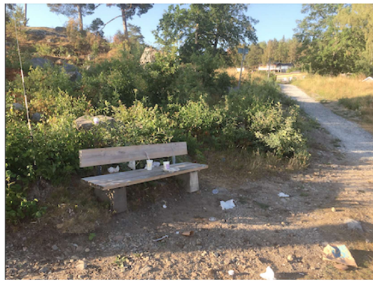
Nedskräpning på vändplan Ekvägen, och vid pannkakan.