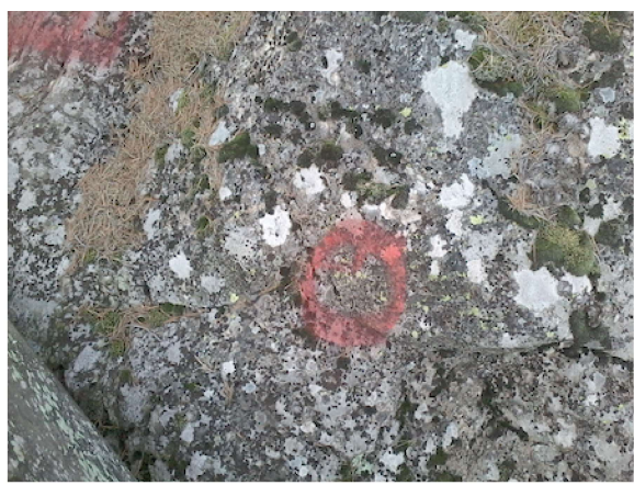
Graffiti på pannkakan (efter tvätt)